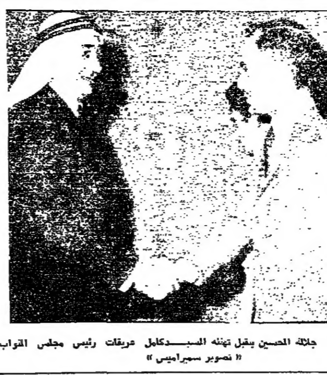
جلالة الحسين يقبل فينتال السيد كمال مرقبات رئيس مجلس القواب